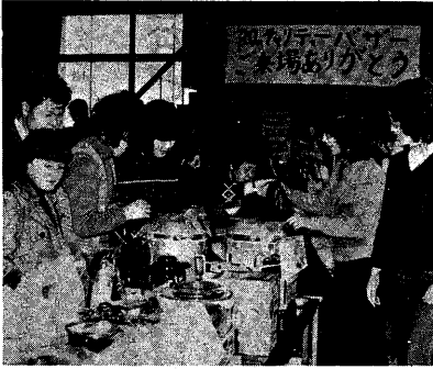
多くの人がつめかけたバザー会場

選挙権を得たことが一番印象的でした。社会に目を向けていなければならぬ年になったという意味で、何かき