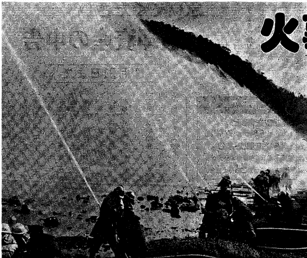
火事のない町めざして力強く一斉放水