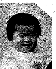
「ゆきちゃん」と呼ばれ、この欄に掲載されています。この欄に掲載されています。この欄に掲載されています。

1月25日(日) 市民スキー教室を開きます。この運動は、物価を安定させるために、このマークを掲げています。