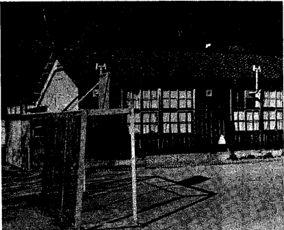
全面改築される笠取第二小学校の木造校舎

市では、昨年十月「宇治市実施計画昭和56~58年度」を策定、そのあらましをシリーズでお知らせしています。最終回は、心のゆたかさや安全で快適なくらしの場をめざす施策についてお知らせしましょう。