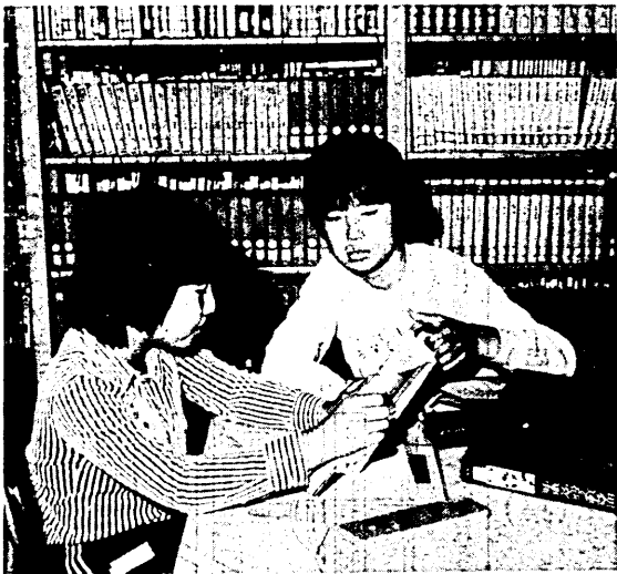
読書や勉強に一番よい季節(市民図書室で)

澄んだ夕やかな夜夜の中、の灯火は秋のものとして、これらが一年中で最も読書に適した時期、いわゆる「読書は私たちの生活を豊かにするだけでなく、知識や想像力を広げ、一人ひとりの市民の心と心を繋ぎあわせていくことに繋がります。市民図書室では、