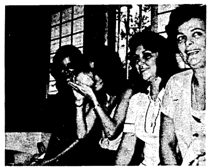
本場のお手前を味わうブラジルからのお客さん

夏の閑情を感じました市営茶室「対鳳庵」が一日から開席しています。 この日、ブラジルなどから来日した婦人九人が平等院からの帰りに訪れ、宇治茶を一服。なれぬ手つきでお茶を飲みました。 対鳳庵は、十一月三十日まで、開席期間中、午後四時まで開いています。 涼風の吹きはじめる手川川べりを散歩される時、お気軽にお立ち寄りください。 料金は、抹茶・煎茶ともお茶子がついて一服二百五十円です。