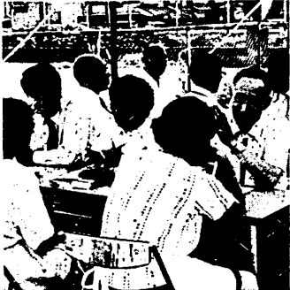
両助役も奥さんたちと熱心に対話

家庭に眠っているものに再び命を吹きこもう。市では、今月から省資源の取組の一環として「不用品交換」の仲介を始めています。これは、「譲りたい」譲ってほしい」という登録が三つあれば、その登録の中から「譲りたい」という登録が三つある希望者が商品の特注をすることができます。しかし、希望者紹介、両者の間で話をつけて、決めたいというところまで提供してくださる人を待ちます。