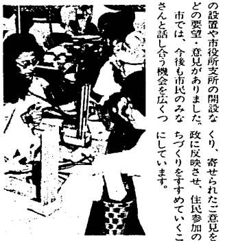
血圧測定も多くの人が利用