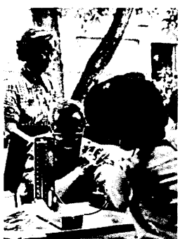
血圧はどのくらいかな…(木幡公民館で)

今年も上二日から住民検診がはじまっています。この住民検診は、六月十六日まで市内全域の五十カ所へ検診車で巡回して行われます。 住民検診の対象となりますのは、職場や学校などで検診を受ける機会のない十五歳以上の市民のみです。 検診の内容は、胸部レントゲン撮影、問診、尿検査、血圧測定です。この結果、異常ありと思われる人に結核精密検査や循環器検査を実施、さらに必要のある人には、精密検査を行うこととなります。 ところで、昭和五十四年度の住民検診の結果は、受診した六千四百一人のうち、五十八人が循環器検診、九