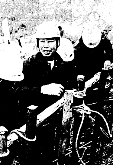
この日は、緊急要員を残し全隊員が参加しました。

関西エスプレント 大会 写真集「広島・長崎」にエスプレント語を採用した岩倉さんに記念講演や朗読会を行います。また、みなさんに理解を深めていただくエスプレント語の出版物の展示もしています。 ▼大会：5月24日、25日、26日