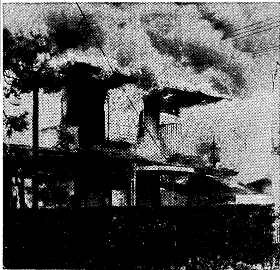
炎と黒煙をあげて燃える民家(昨年7月広野町で)