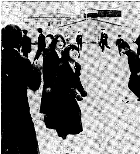
子どもたちの健全な成長を……(宇治中で)