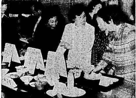
カロリーは大いじょうぶ? 熱心に説明を聞く参加者