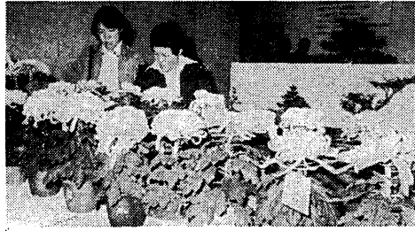
秋の市民文化祭 丹精こめた菊の鉢、盆栽、生け花、書、手芸作品など日ごろの成果を披露。11月3日と4日、市民会館を中心にご多様な作品が並べられ、訪れた人たちの目を楽ませていました。

市では、町内会自治会が管理する街灯の電気料を補助して... (1)9月の電気料の定額料金を10月分と見做すこととする。