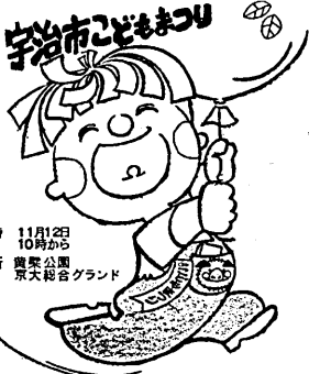
宇治市子どもまつり 11月25日(土) 10時～16時 京大グラウンド

宇治市福祉協議会では、市民のみなさんにも福祉に対する理解を深めていただき、福祉を向上させよう、11月18日(日)の午後2時から久保小学校で第4回宇治市福祉バザーを行います。