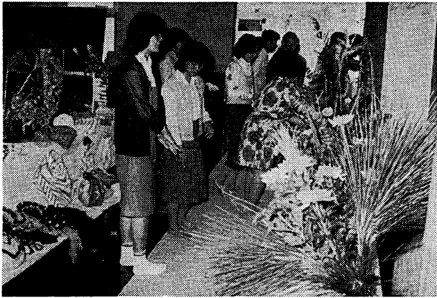
ポリオ生ワクチン服用の日程

各地域でも文化祭が盛んに行われています。市民文化センターを中心に、各地域の公民館でも、お祭り気分が盛り上がりつつあります。市民文化センターでは、11月5日、6日に市民文化祭を開催し、市民文化センターを中心に、各地域の公民館でも、お祭り気分が盛り上がりつつあります。