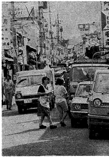
自動車の路上駐車はみんなのめいわく 交通事故の原因にもなります

八月一日から「道路を守る月間」が始まりました。この間は、路上に物を置かないで、道路をきれいに保つことが大切です。また、交通違反を減らすことも重要なことです。 道路は、私たちの生活にとって欠かせないものです。道路が汚れたり、物が置かれたりすると、交通の妨げになります。また、事故の原因にもなります。 道路を守るためには、路上に物を置かないことが大切です。また、交通違反を減らすことも重要なことです。