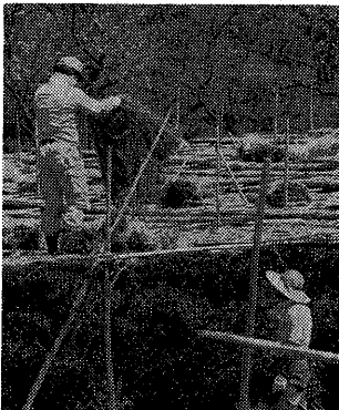
面影日光を防ぎ、良質の茶を搾るため、覆いをしてきた五福園

生活環境の整備は、市民の健康と生活の質を向上させるために不可欠です。水不足の解消や、排水設備の整備など、重要な課題に取り組んでいます。