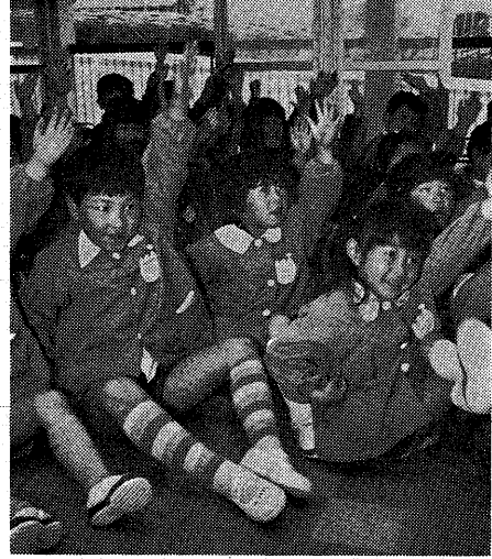
新しい園舎で元気にあそびまわす (4月13日木幡幼稚園で)

ことしも新たに小学校と中学校、幼稚園がそれぞれ一つずつ誕生。希望に胸をふくらませた児童・生徒が入学しました。