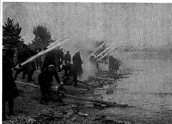
(初式) 24本のホースからの力つよい一斉放水—火事のないうち市をめぐり、さる1月7日宇治川塔ノ島で、消防出初式が行われました。

文化財防火デーは、昭和十四年一月二十六日法隆寺が焼失し、貴重な文化財がまたひとつ灰になりまし。これを機会に私たちが一人ひとりが文化財と防火についてしんげんを考へてみましょう。 文化財防火デーは、昭和十四年一月二十六日法隆寺が焼失し、貴重な文化財がまたひとつ灰になりまし。これを機会に私たちが一人ひとりが文化財と防火についてしんげんを考へてみましょう。