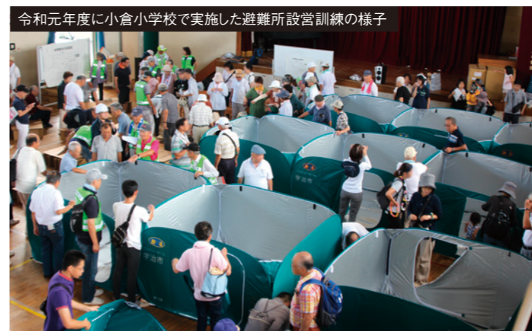
令和元年度に小倉小学校で実施した避難所設営訓練の様子

ハザードマップ等を利用して、避難先(自宅や親戚・知人宅等)の安全性を確認しましょう。