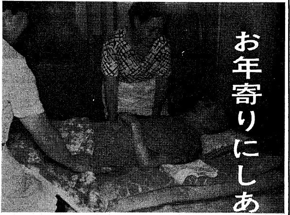
(毎日お年寄りの世話を続ける老人家庭福祉員)