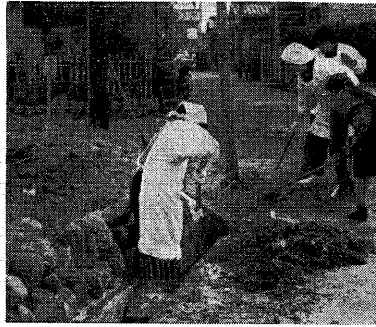
美しい町づくりをめざして主婦の自発的な清掃作業 (木幡山手町で)

環境衛生連合会は、市内各地域が一体となり、家族の健康と公衆衛生の向上をはかり、明るい地域社会の建設、伝統的な町並み・清潔な町づくりに自主的におし進め、市の衛生行政に積極的な協力をする自治体です。 昭和二十年の発足初は地区別でしたが、人口増加と地区の拡大による献身的な協力により、現在は市内に五十六地区、二万四千四百世帯まで拡大されました。しかし、まだ環境衛生連合会に加入していない地域がありますので、加入されるようお願いします。 環境衛生連合会の重大な任務は、清掃活動の推進、伝統的町並みの維持と発展、自治体としての責任の果たし方、市民の健康と生活の向上に努めることです。