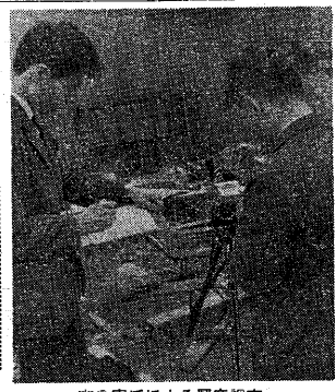
市公害係による騒音調査