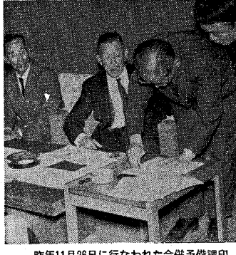
昨年11月26日に行なわれた合併準備印刷

新しい時代の要求に応じた新しい建設が困難となり、地域の農業者の協力を得る必要が生じた。市内の農協は、体質を改善して発足し、農業振興にテコ入れをする。市内の農協は、体質を改善して発足し、農業振興にテコ入れをする。