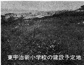
東宇治新小の建設予定地

木幡 古河 修 六ヶ庄、木幡の北西部から東宇治小学校まで通じる道路の整備が、東宇治小学校の建設に大きく影響している。この道路は、交通の便を大きく改善し、児童の通学に大きな支障を及ぼしている。市は、この道路の整備を優先的に進めなければならない。