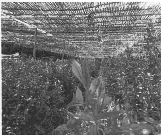
二重の遮光ネットやよしずで日照が調整されている