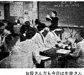
お母さん方も今日は生徒さん