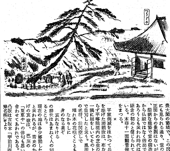
今昔宇治名所図説

寺伝によれば河原左大臣源融が、この堂から手治川に釣糸を垂れて樂しんだとある。 豊大園の築堤で、この図にも見られる通り、堂の正面からの景観はないが、簡明な建築で堂の構造から伝説ではなく、釣殿であることがよくわかる。時代は鎌倉の初めと推定されている。本堂十一面観音像をまつる。 ▲問(一) 扇の芝と釣殿 ▲問(二) 扇の芝と釣殿 ▲問(三) 扇の芝と釣殿 ▲問(四) 扇の芝と釣殿 ▲問(五) 扇の芝と釣殿