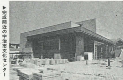
完成間近の宇治市文化センター (8月31日撮影)

受給できる年金は一つだけ 国民年金は、いろいろな種類の給付があります。しかし、国民年金が二つ以上の年金受給の対象になると、受給できる年金はその内の一つだけです。いずれか自分に有利な年金を選んで、国民年金受給選択申出書(国民年金係)提出してください。(保険年金課)