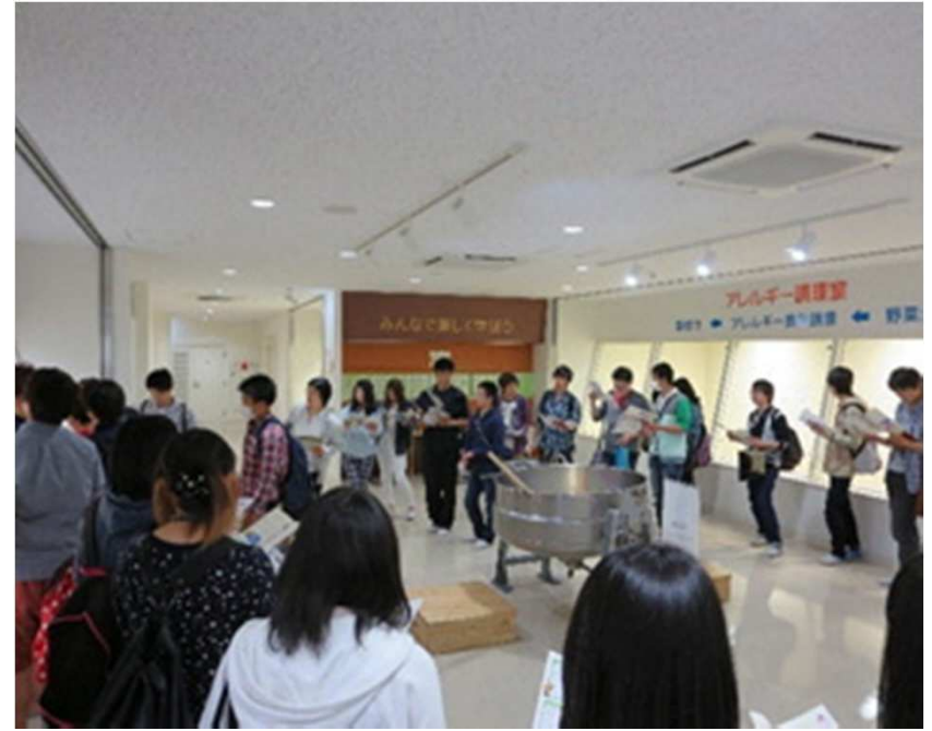
見学通路・ホール