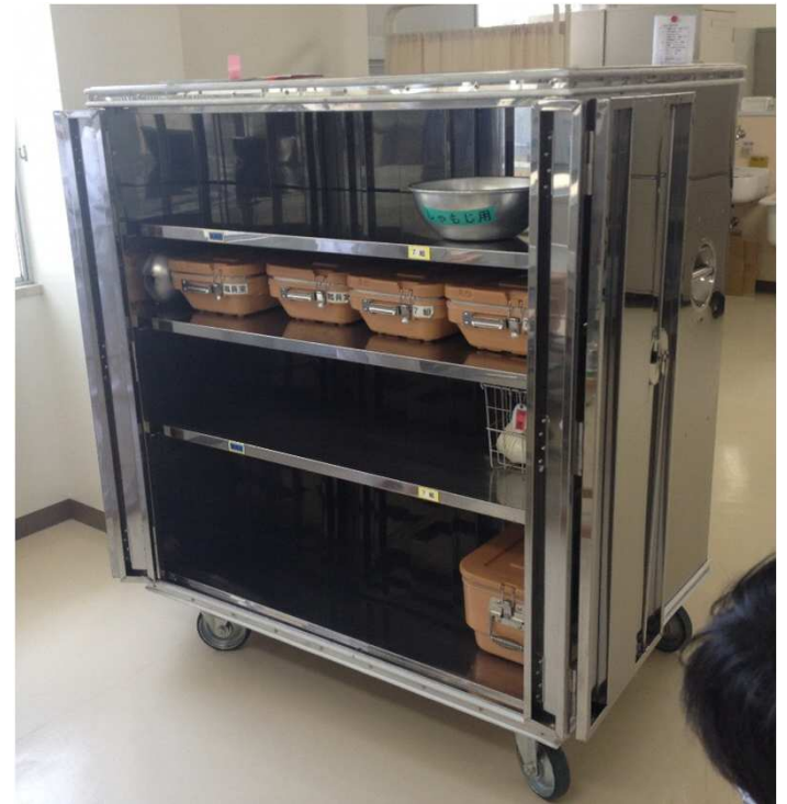
コンテナ 兼 生徒受け渡し口