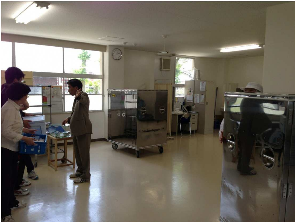
各校の配膳室(子校)