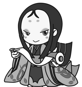
宇治市宣伝大使 ちはや姫