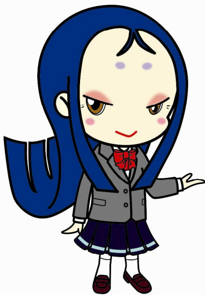
宇治市宣伝大使 ちはや姫