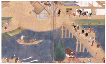
宇治川下流部分に柴舟の様子を描く(「宇治名所図屏風」部分)