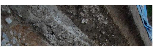
下流側の礫・木杭の並び