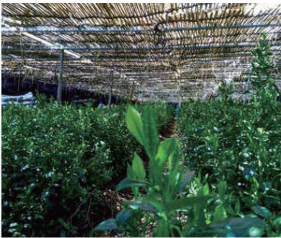
二重の遮光ネットやよしずで日照が調整されている