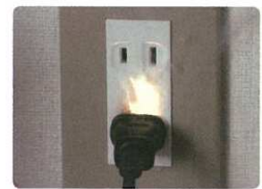
トラッキング火災