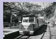
おとぎ電車 タルゴ型車両

昭和25年(1950)から同35年まで、宇治川の渓谷を走っていた「おとぎ電車」。多くの人びとに親しまれ、宇治川ライン観光の一翼をになっていました。おとぎ電車とともに昭和20・30年代の宇治を紹介します。