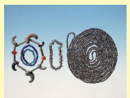
二子山古墳出土 玉類

旧石器時代から江戸時代まで、各時代を特徴づける発掘出土品で通覧します。また、最新の発掘調査より出土した遺物を展示します。