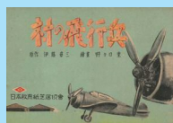
国策紙芝居「村の飛行兵」 宇治市平和都市推進協議会所蔵

宇治市平和都市推進協議会(平推協)に寄贈された戦争遺品及び本館蔵の資料により、戦時中の暮らしについて紹介します。