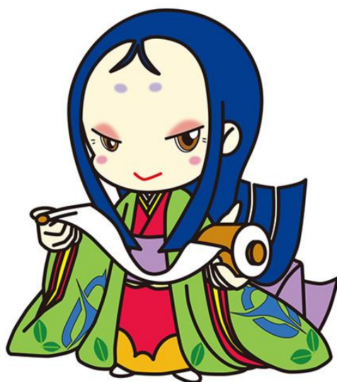
宇治市宣伝大使「ちはや姫」