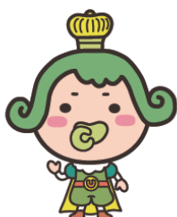
チャチャ王国のおうじちゃま