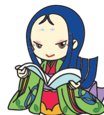
宇治市宣伝大使 ちはや姫