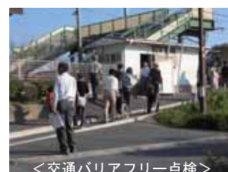
<交通バリアフリー点検>