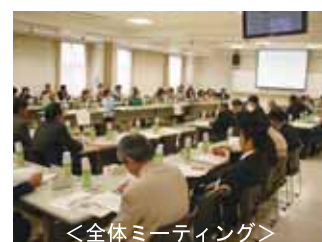
<全体ミーティング>