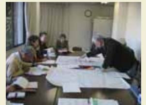
【大久保まちづくりワークショップの検討会場】