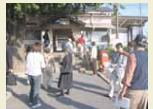
【大久保まちづくりワークショップのタウンウォッチング】