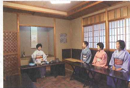
立礼席 (約八畳 椅子)