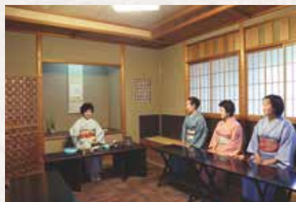
桌椅式茶室 桌椅式茶室