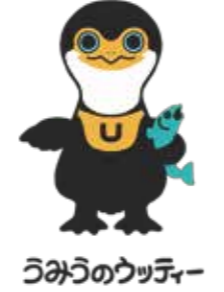
うみうのウッチャー