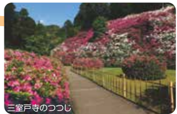
三室戸寺のつつし

太陽ヶ丘の西隣にある約10ヘクタールの植物公園です。園内には、花と水のタペストリー、花の広場、ハーブ園などがあります。●問い合わせ先/0774-39-9387●開園時間/9:00~17:00(入園は16:00まで)●休園日/月曜日、年末年始●住所/宇治市広野町八軒屋谷25-1●JR・京阪「宇治駅」近鉄「大久保駅」からバス「植物公園」下車