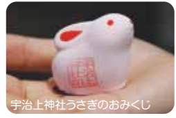
宇治上神社うさぎのおみくじ